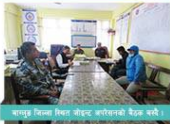
बागलुङ जिल्ला स्थित जोइन्ट अपरेशनको बैठक बस्दै ।