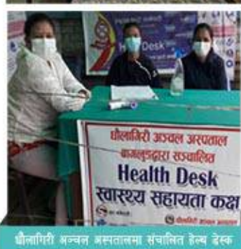
धौलागिरी अञ्चल अस्पतालमा संचालित हेल्थ डेस्क