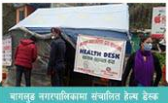
बागलुङ नगरपालिकामा संचालित हेल्थ डेस्क