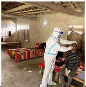
काठेभोला स्थित ज्वर मा.वि मा रहेको क्वारन्टाइन्सबाट PCR परिक्षणका लागि नमूना संकलन गरिदै ।